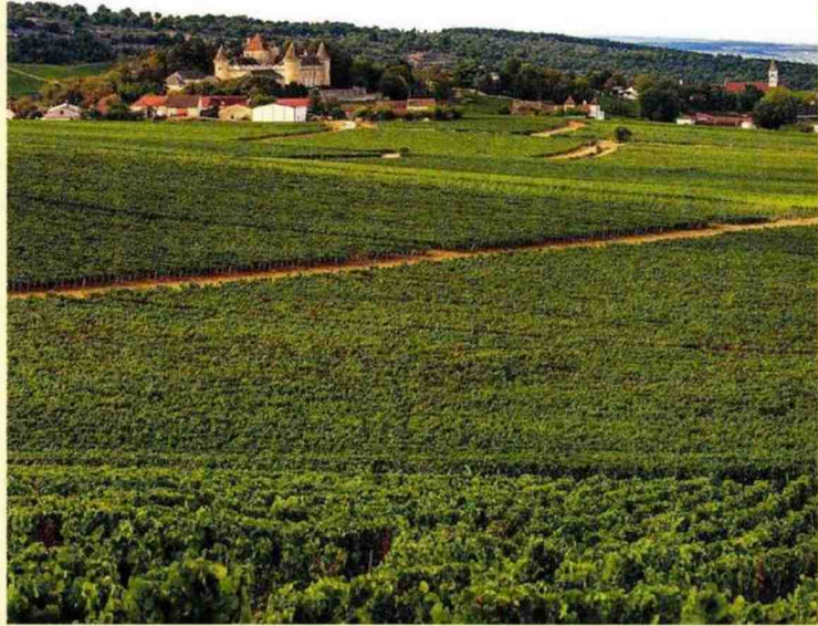
Le Château de Rully

Nez frais avec des notes de mûres. La bouche est pleine de fruit, gourmande, fine, avec une belle densité de tanins.